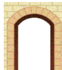
“a sesto ribassato”