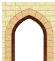
“ a sesto acuto”